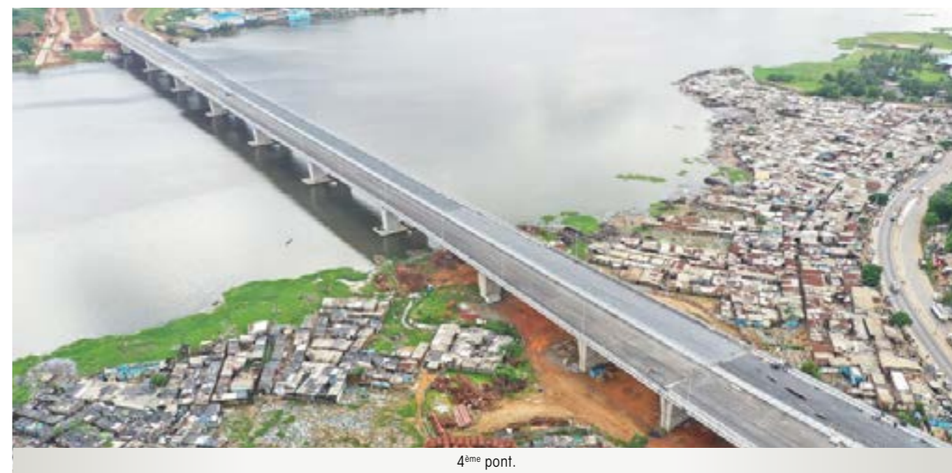
4 ème pont.