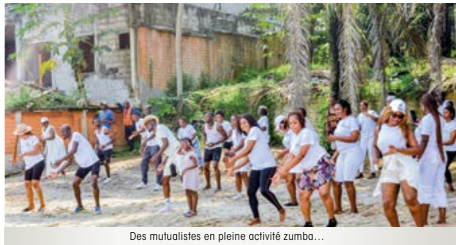
Des mutualistes en pleine activité zumba...

Les équipes vainqueuses sont réparties chacune avec une enveloppe.