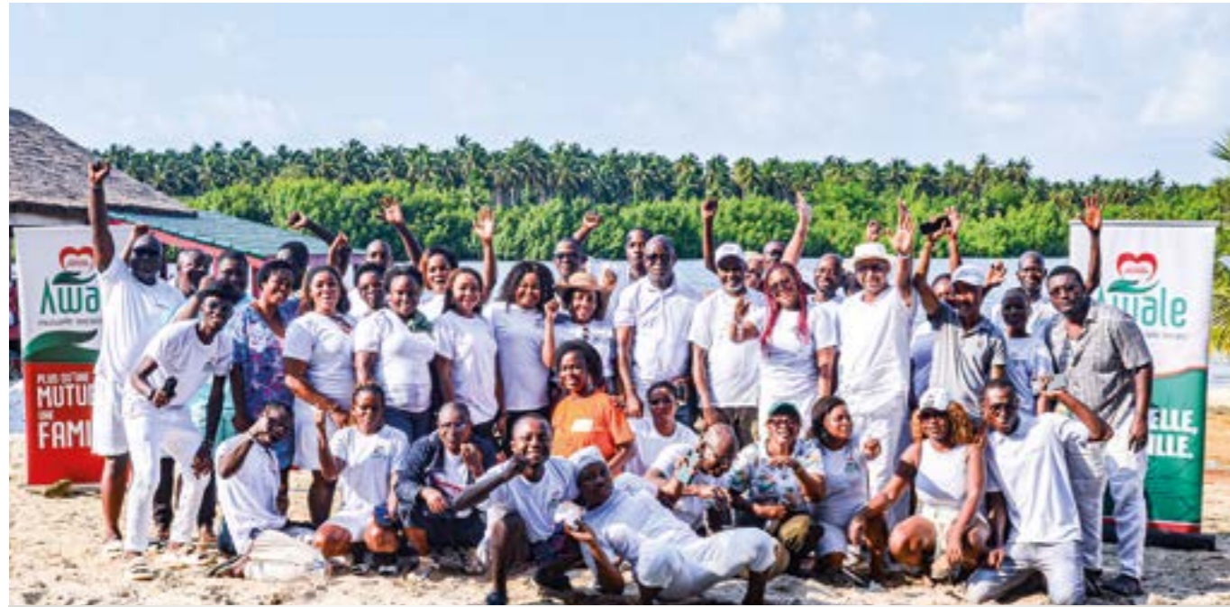
Belle photo de famille après la rencontre.