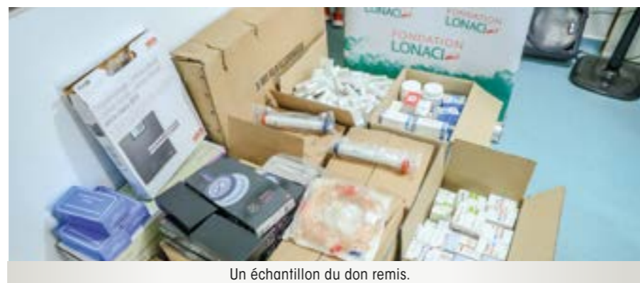
Un échantillon du don remis.