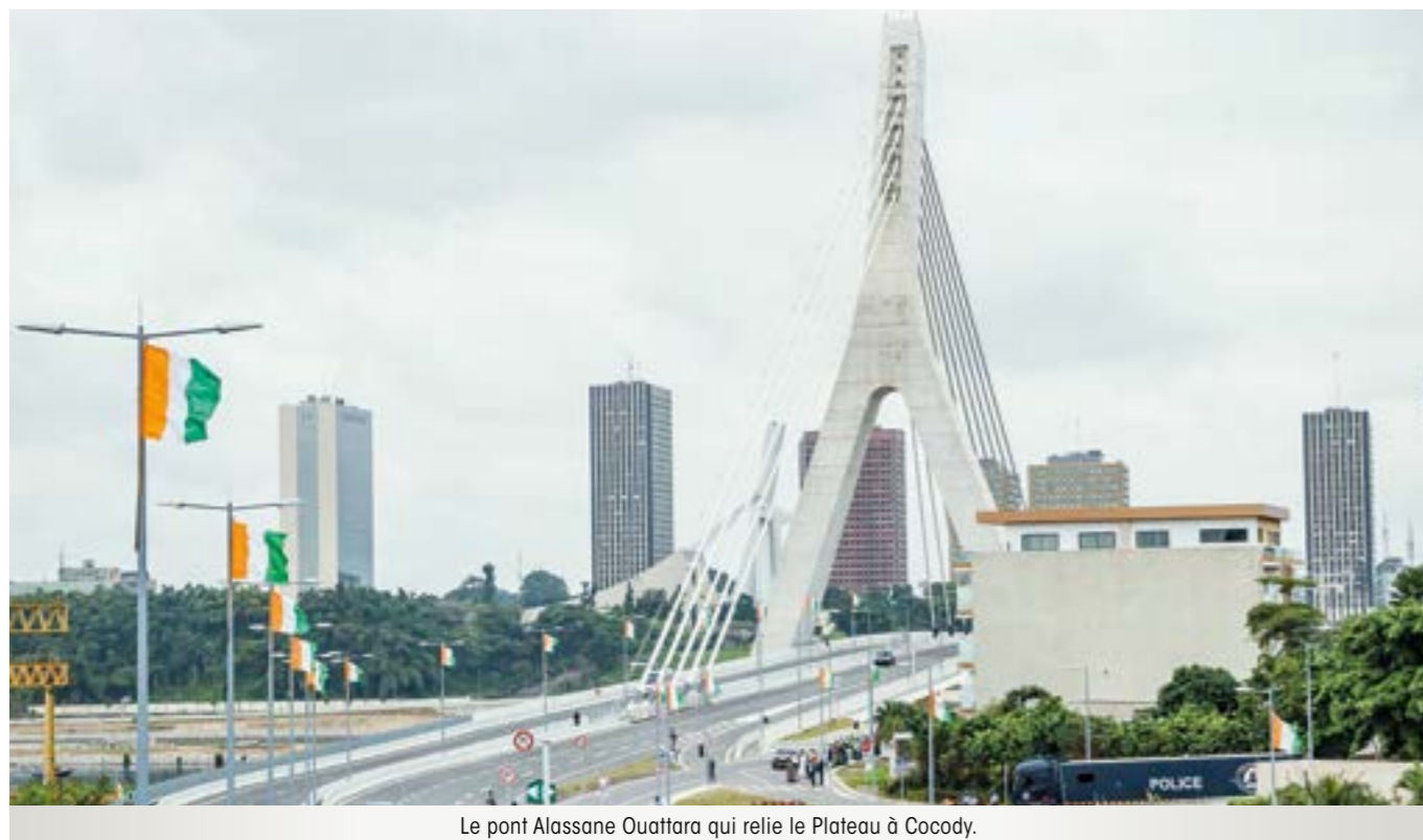
Le pont Alassane Ouattara qui relie le Plateau à Cocody.