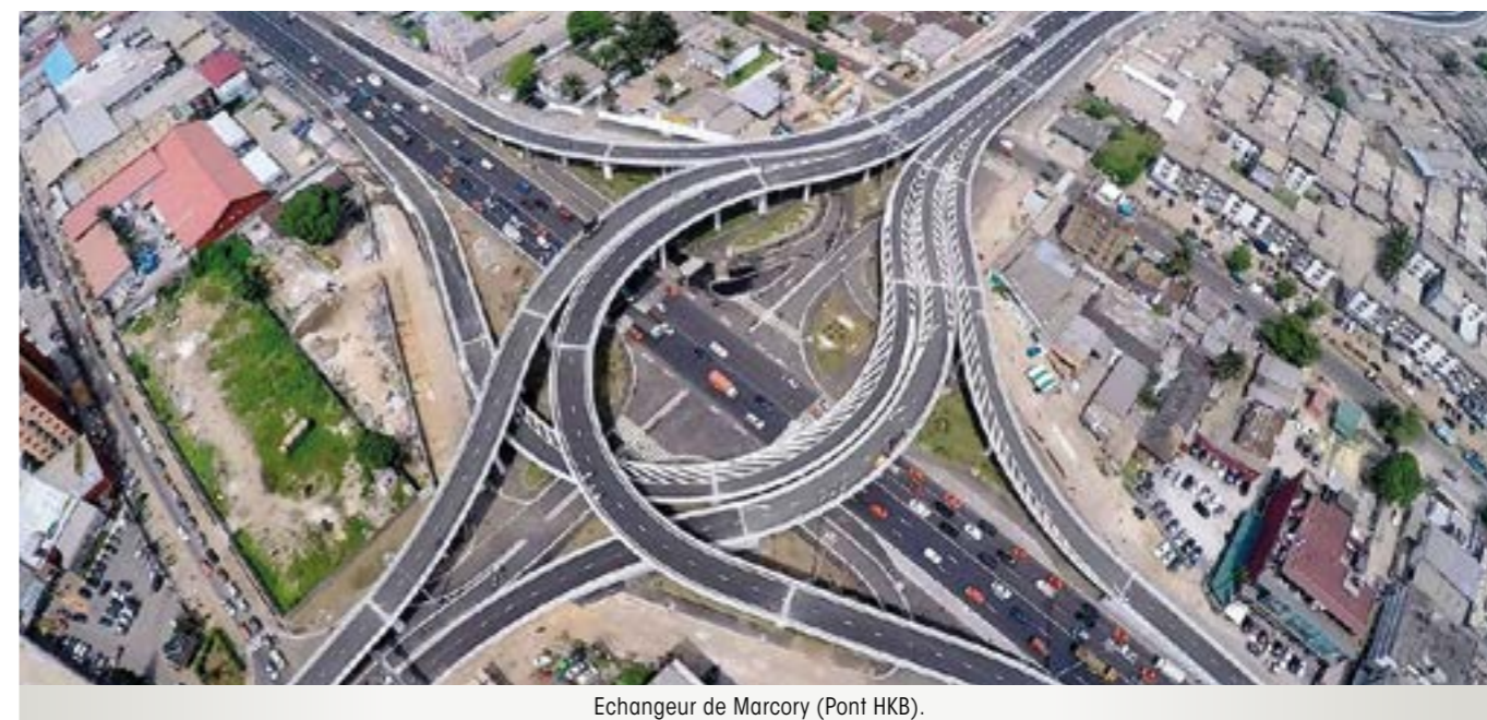
Echangeur de Marcory (Pont HKB).