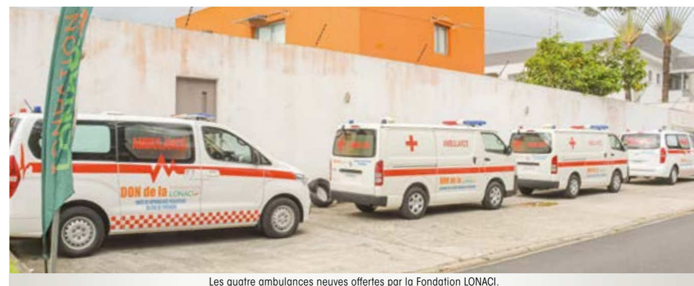
Les quatre ambulances neuves offertes par la Fondation LONACI.