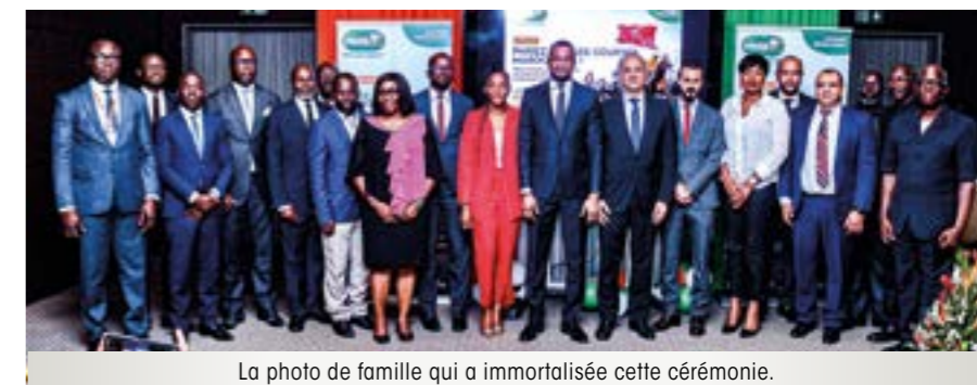
La photo de famille qui a immortalisé cette cérémonie.