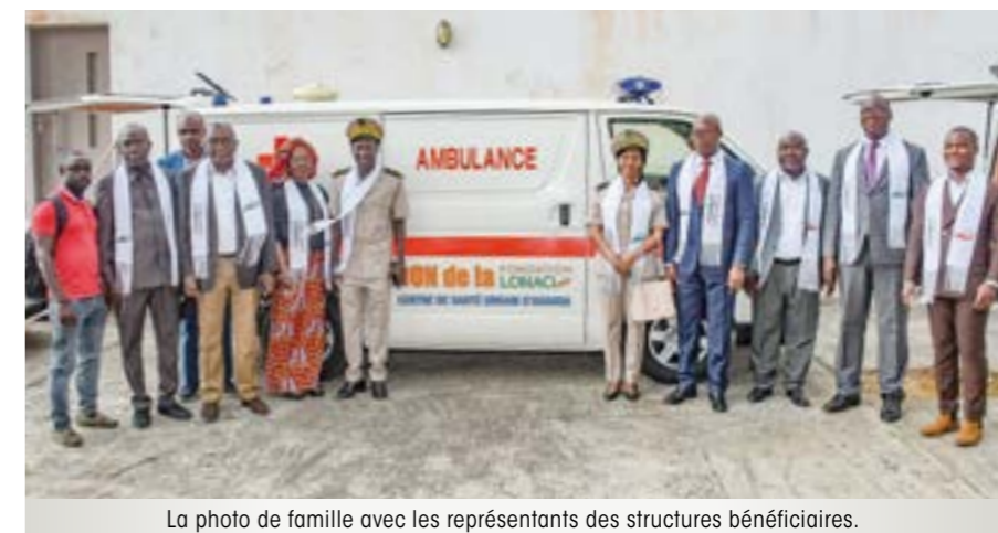
La photo de famille avec les représentants des structures bénéficiaires.