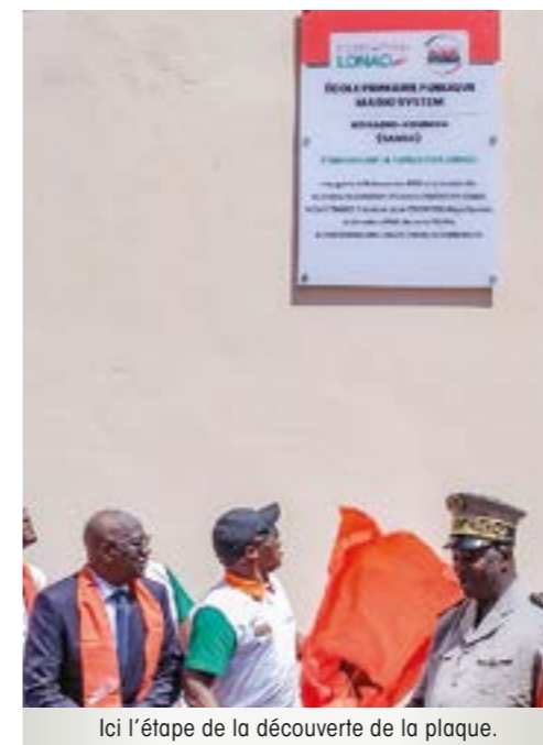
Ici l'étape de la découverte de la plaque.