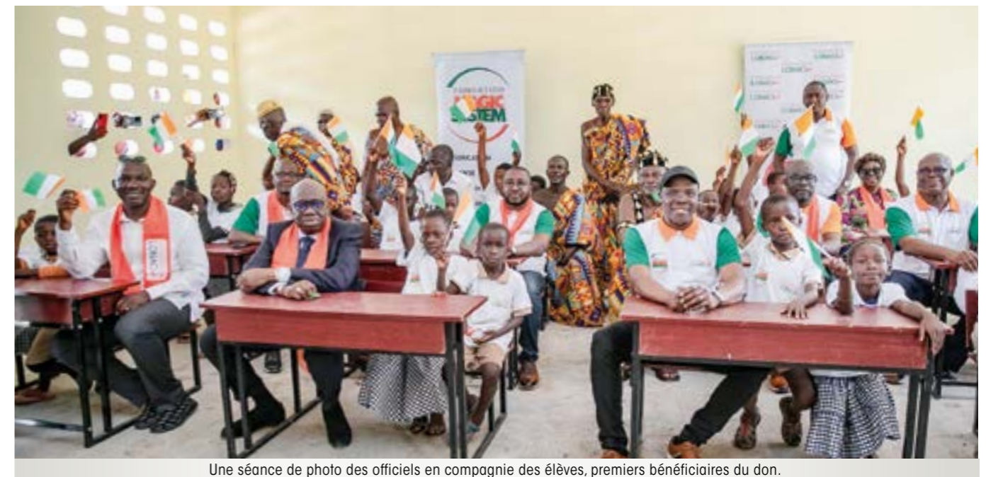
Une séance de photo des officiels en compagnie des élèves, premiers bénéficiaires du don.