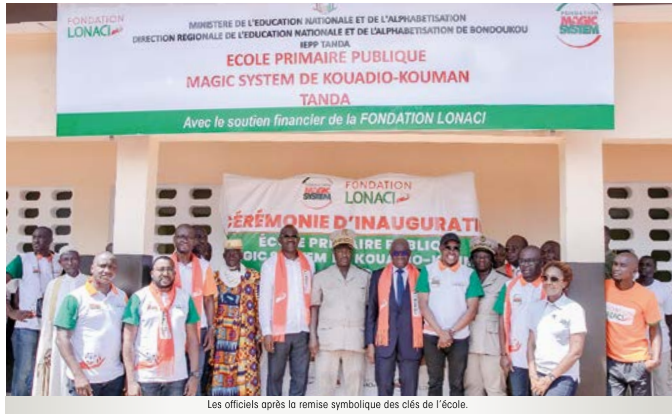
Les officiels après la remise symbolique des clés de l'école.