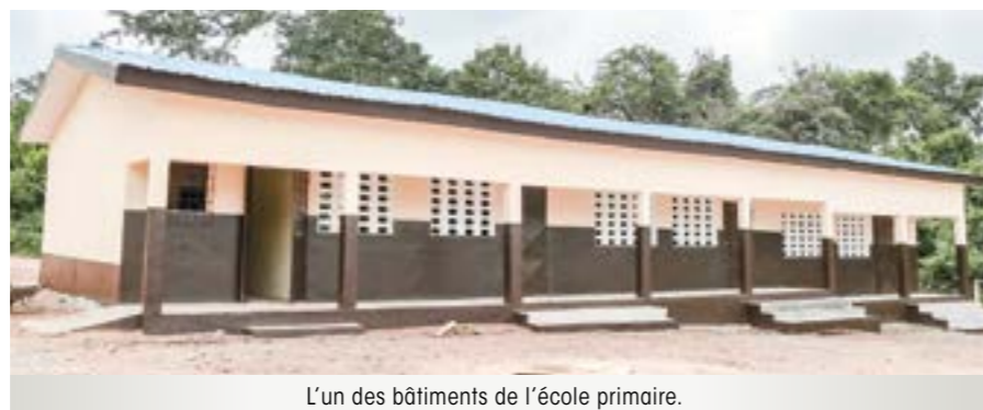
L'un des bâtiments de l'école primaire.