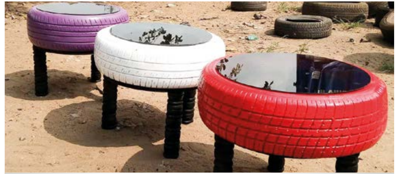
Quelques-unes des réalisations de l'artisan Bafétégué Kamagaté.