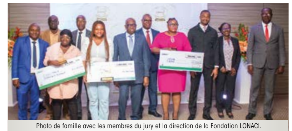
Photo de famille avec les membres du jury et la direction de la Fondation LONACI.

La présente édition s'est déroulée du 13 juillet au 15 octobre 2023. Le Jury a reçu 22 articles de belle facture traitant des grands genres (reportage, enquête, dossier, interview), émanant des journalistes de la presse écrite (agence de presse, presse en ligne et imprimée) et de l'audiovisuel (radio, télévision classique et numérique).