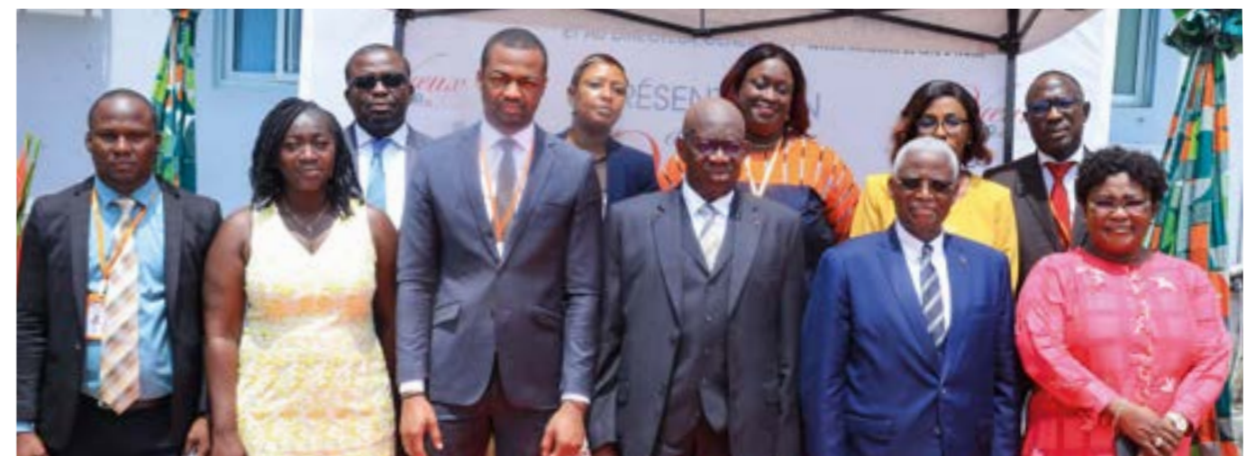
... des chefs d'agence...