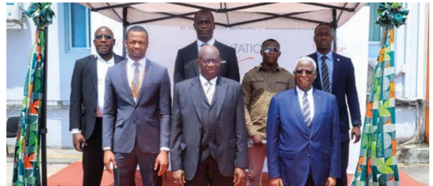
... et les membres de la sécurité.