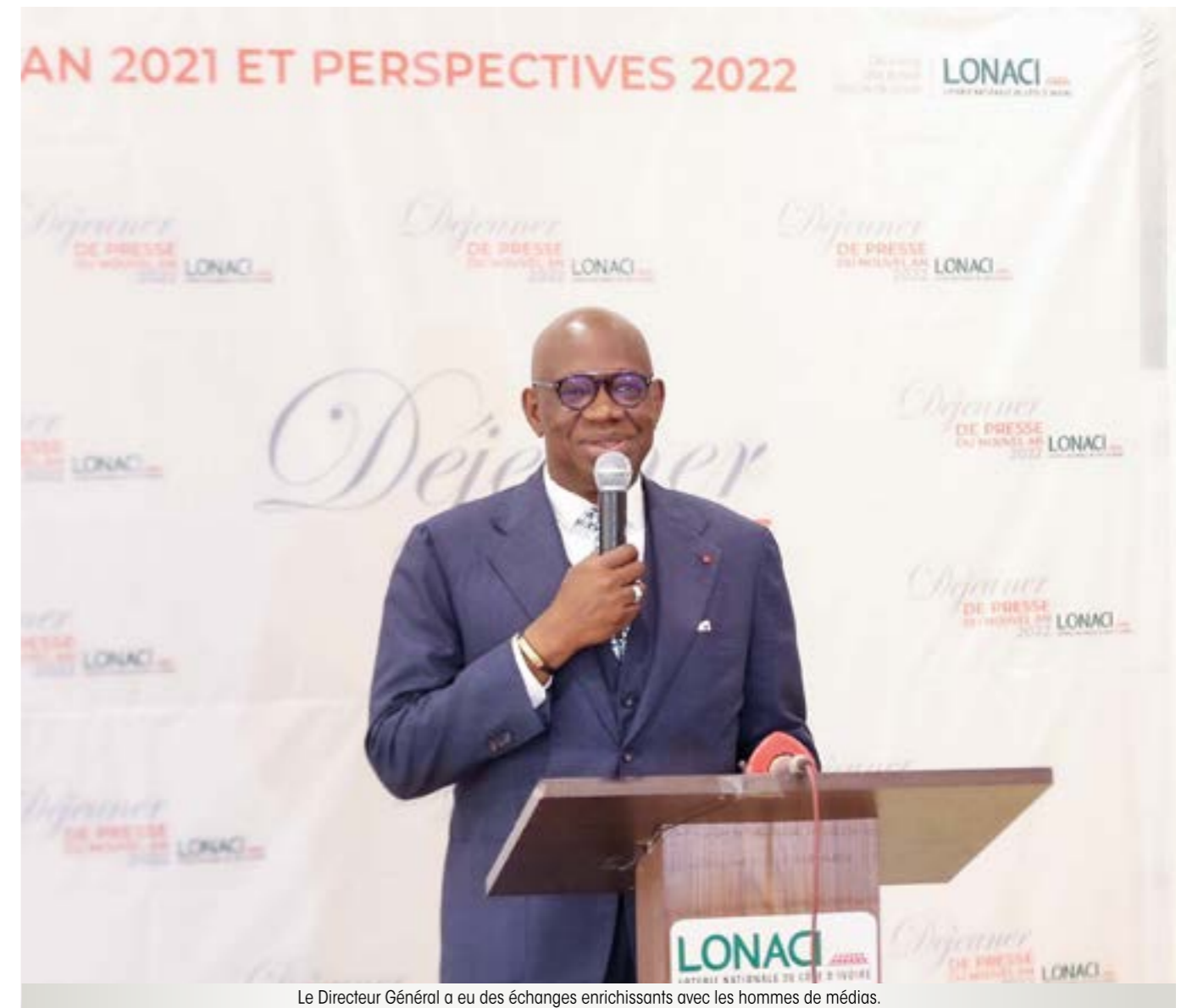
Le Directeur Général a eu des échanges enrichissants avec les hommes de médias.