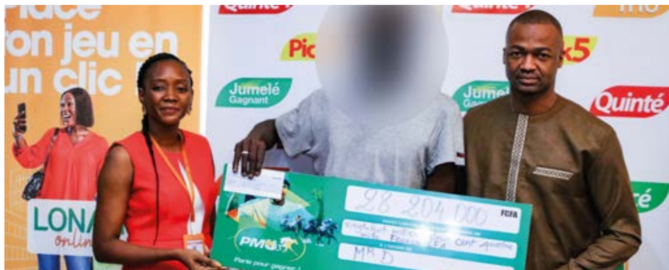
Le Directeur Général Adjoint a remis son chèque au gagnant du PMU.