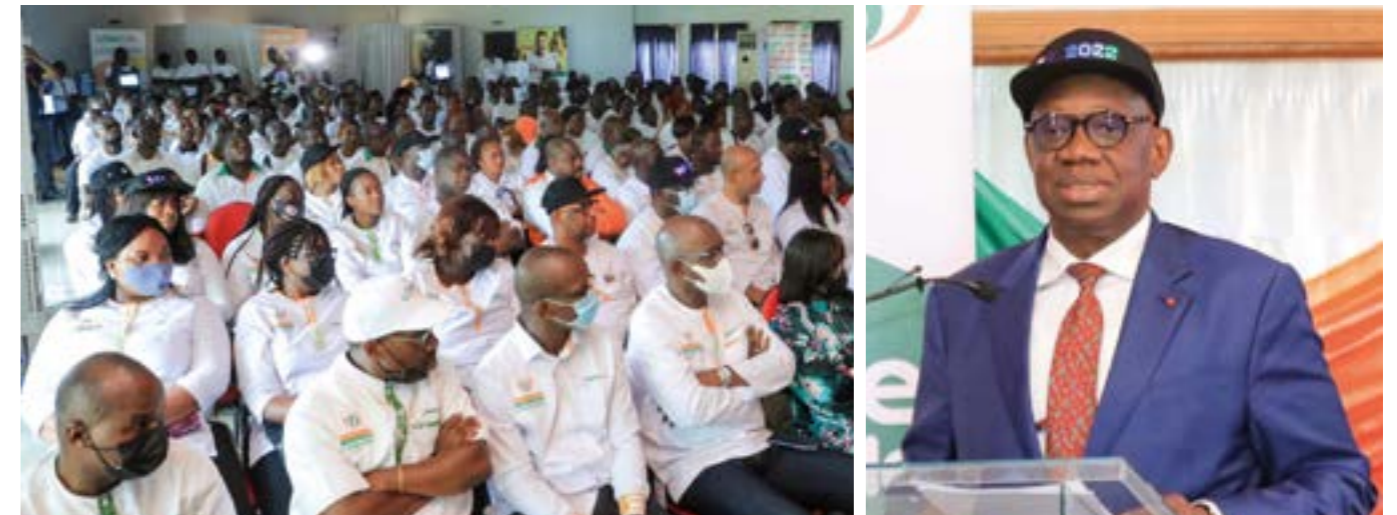
Le Directeur Général a appelé la force de vente à se mobiliser autour des objectifs commerciaux de 2022.