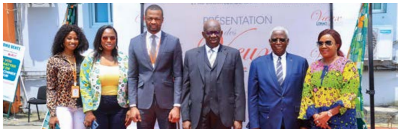
... Assistantes du Directeur Général et du Directeur Général Adjoint...