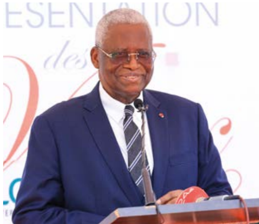
Le Président du Conseil d'Administration a félicité le Directeur Général et l'ensemble du personnel pour avoir hissé la LONACI au rang des meilleures entreprises publiques.