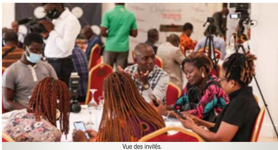
Vue des invités.