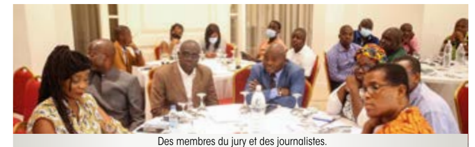
Des membres du jury et des journalistes.

quatrième édition, récompense le meilleur article ou reportage vidéo à caractère social. En plus de susciter une émulation pour les candidats, il contribue à faire le plaidoyer en faveur des communautés qui peuvent alors bénéficier des œuvres sociales de la FONDATION LONACI.