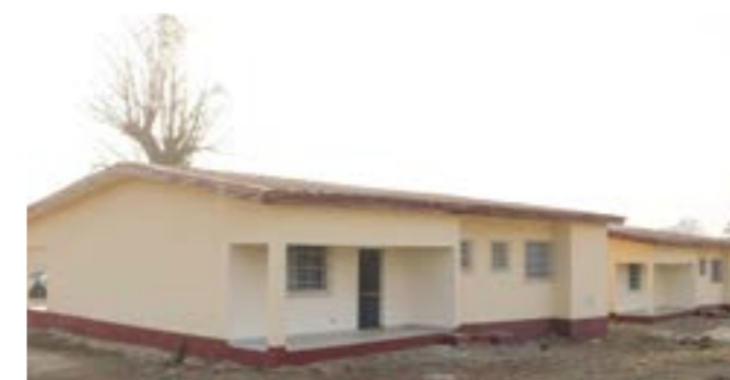
Les logements offerts.