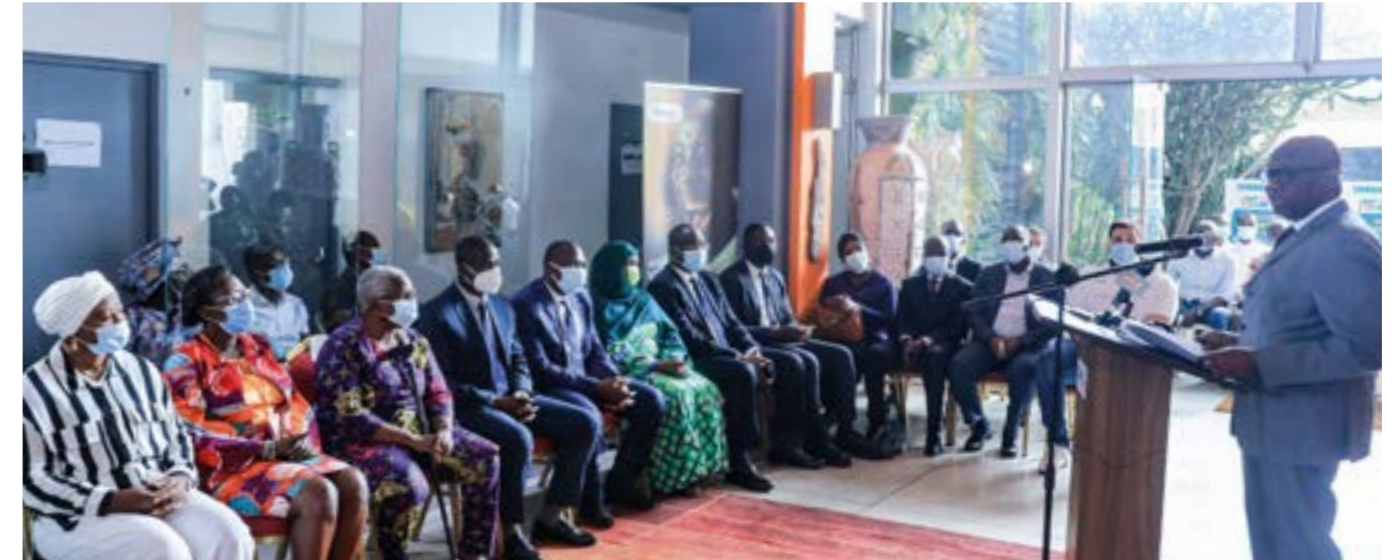
Dans son adresse, le Directeur Général a indiqué que la LONACI est résolument engagée dans l'exécution de sa mission sociale.