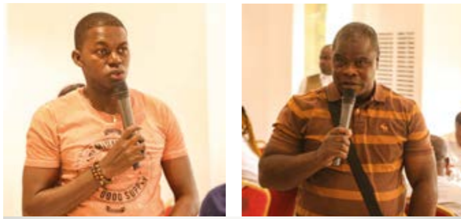
Des journalistes pendant les échanges.