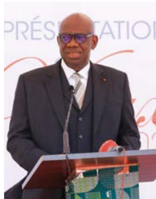
Le Directeur Général a donné des instructions pour l'accélération du projet immobilier du personnel.