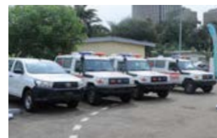
Quelques uns des véhicules offerts par la Fondation LONACI.

Il faut noter la présence à la cérémonie du Conseil du Café-Cacao qui a offert des véhicules pick-up et de transport de troupes aux Forces de défense et de sécurité.