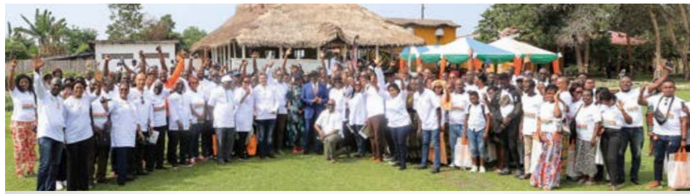
La force de vente mobilisée pour l'atteinte des objectifs commerciaux 2022.