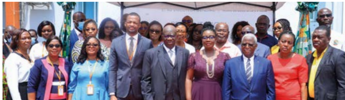
... des membres du personnel...