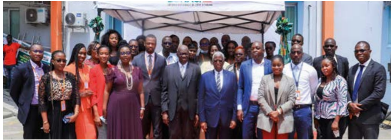
... des membres du personnel...