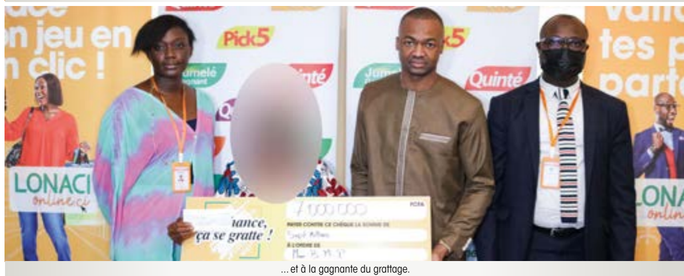
... et à la gagnante du grattage.