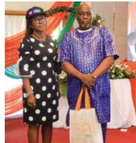
Des concessionnaires et délégués tirés au sort sont repartis avec des gadgets.