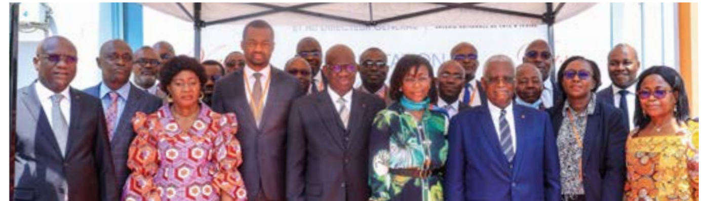
Photo de famille avec le CODIR...