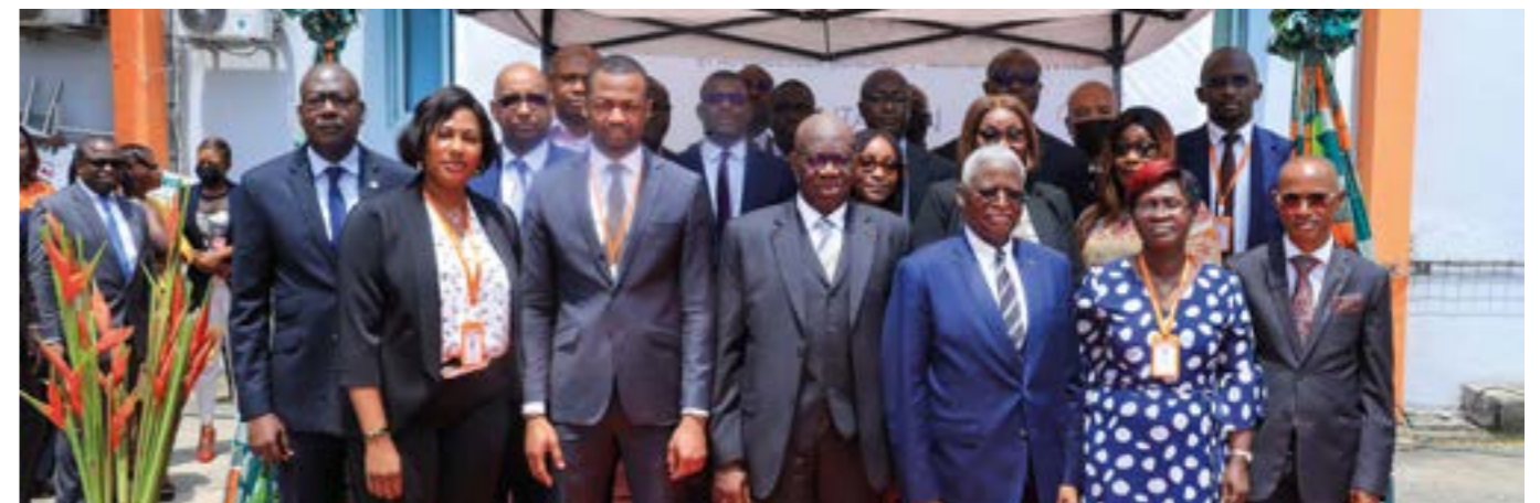
... des chefs de service...