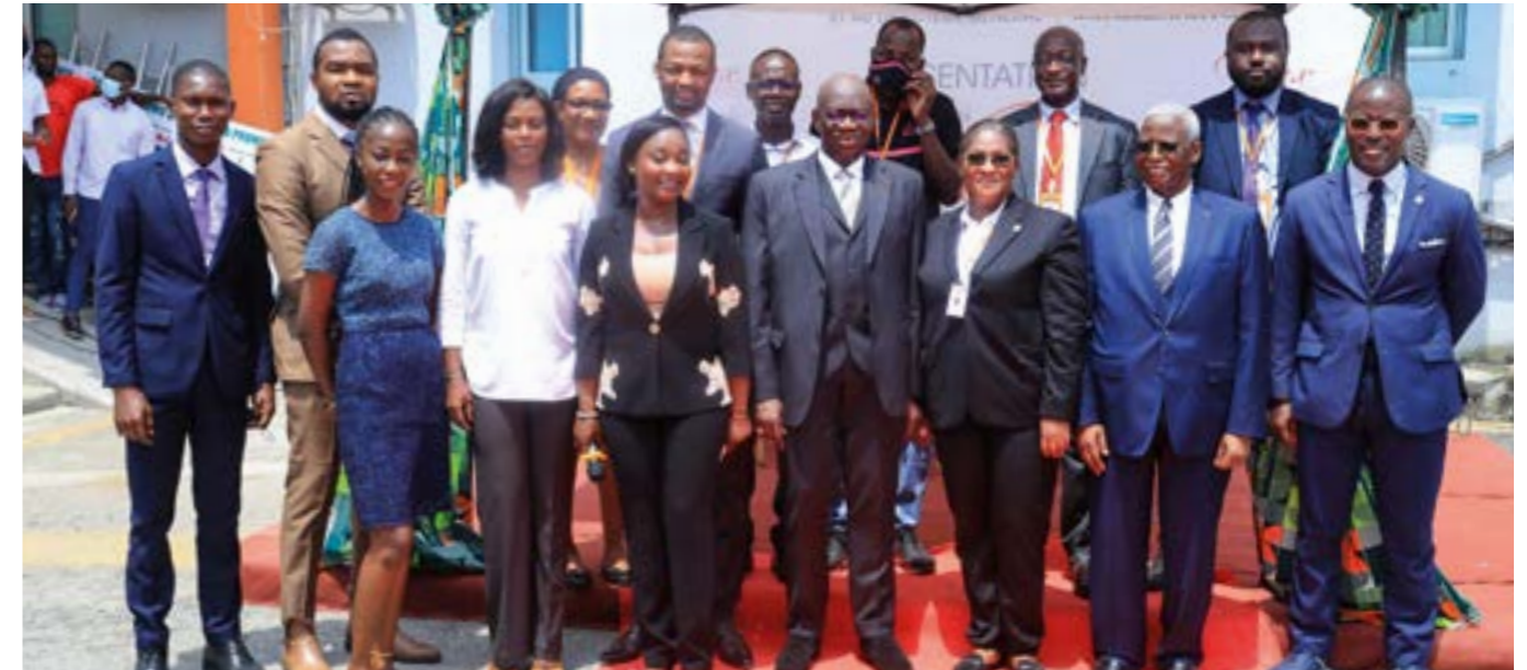
... Le Service communication et le Protocole...