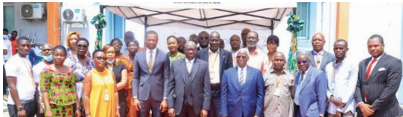
... des membres du personnel...