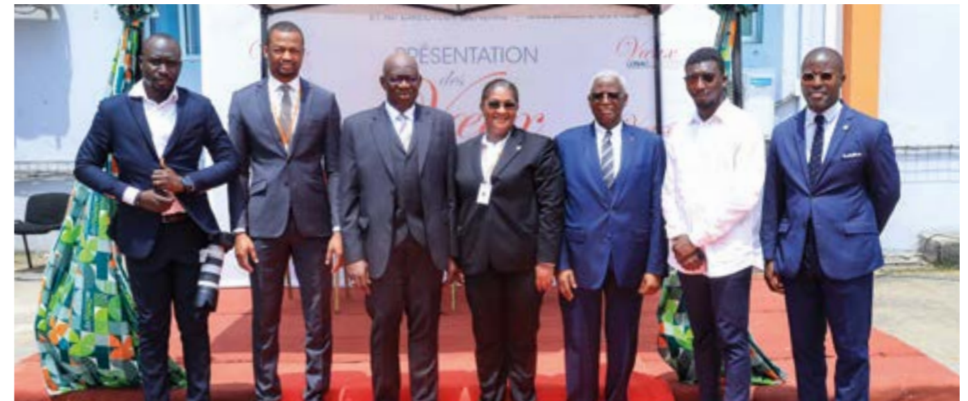
... des membres du Protocole et de la communication...