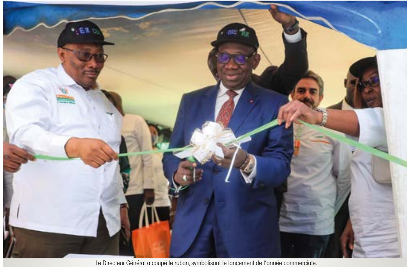
Le Directeur Général a coupé le ruban, symbolisant le lancement de l'année commerciale.