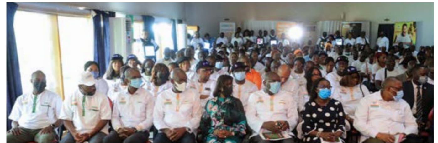
Vue de la salle avec au premier rang les membres du Comité de direction.