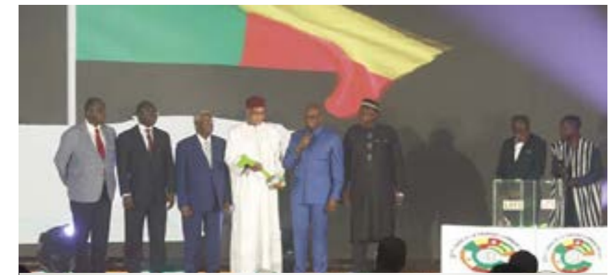
Les officiels lors de la proclamation des résultats.

Le clou de la TCE 2021, ce fut le tirage des gros lots dans la soirée du vendredi 24 septembre à l'espace Latrille Event de Cocody-Les II Plateaux. La cérémonie a été retransmise en direct sur la télévision nationale RTI1. La chance a souri au Bénin qui a remporté le gros lot de 10 millions de Fcfa. Par ailleurs, au cours de la soirée du tirage, le secrétariat exécutif du Conseil de l'Entente a proclamé les résultats de son appel à projets dans le cadre du concours « Jeunes et Entrepreneuriat » et « Femmes et Activités Génératrices de Revenus (AGR) ». Les six lauréats ont reçu chacun un chèque de 5 millions de FCFA.