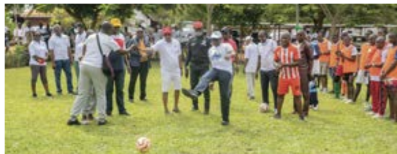
Le coup de pied magistral du Directeur Général.