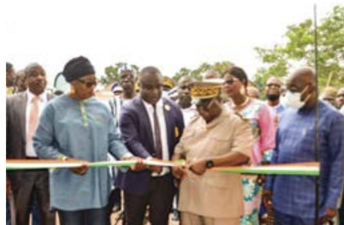
Le Préfet de Dabakala, M. N'Dri N'Guessan, lors de l'inauguration officielle de l'IEPP.