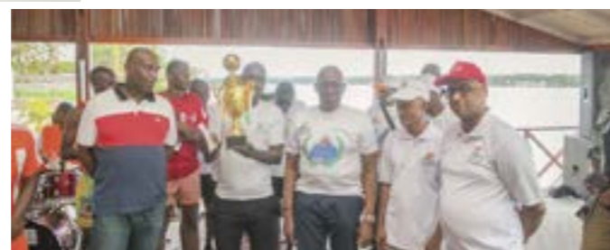
Les gagnants des tournois sportifs récompensés.