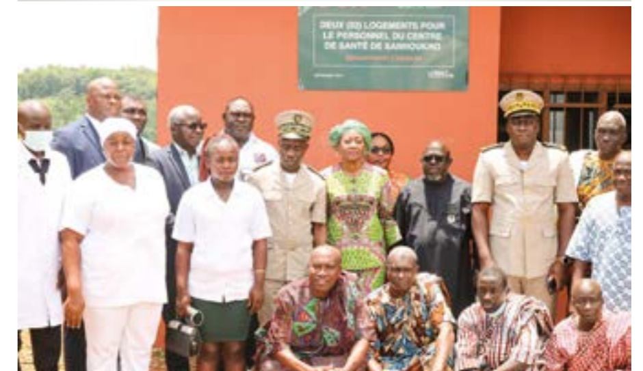
La photo de famille qui a immortalisé cette cérémonie.