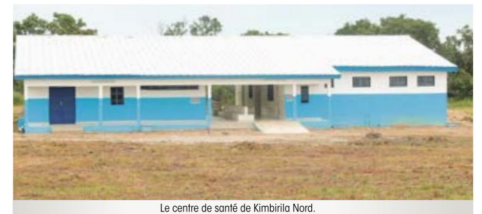
Le centre de santé de Kimbirila Nord.