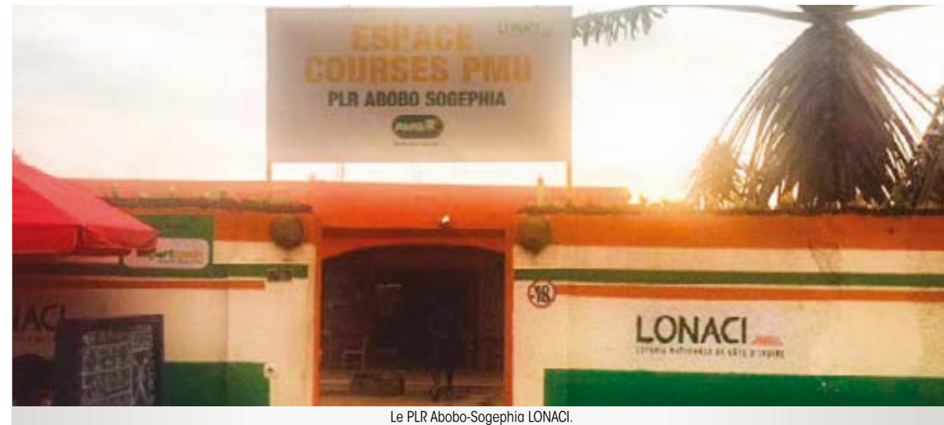
Le PLR Abobo-Sogefiha LONACI.