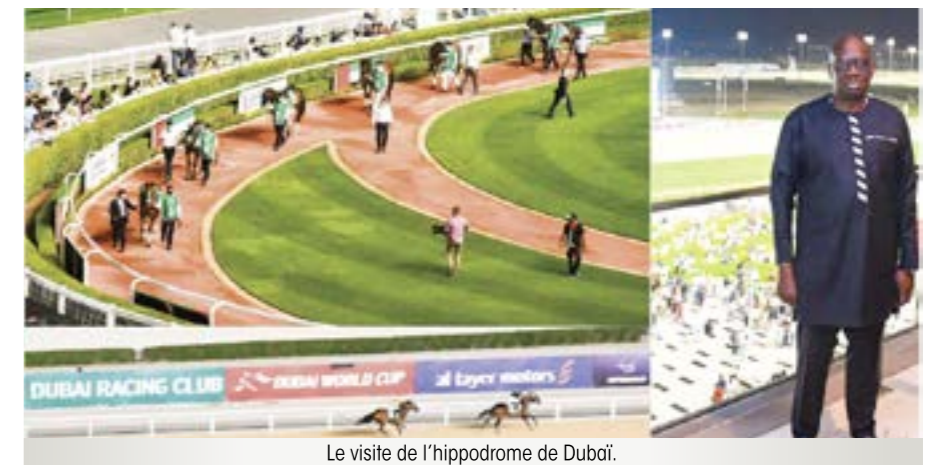
Le visite de l'hippodrome de Dubaï.

L'objectif de cette visite étant de s'inspirer du modèle émirati en vue de l'ouverture d'un hippodrome en Côte d'Ivoire.