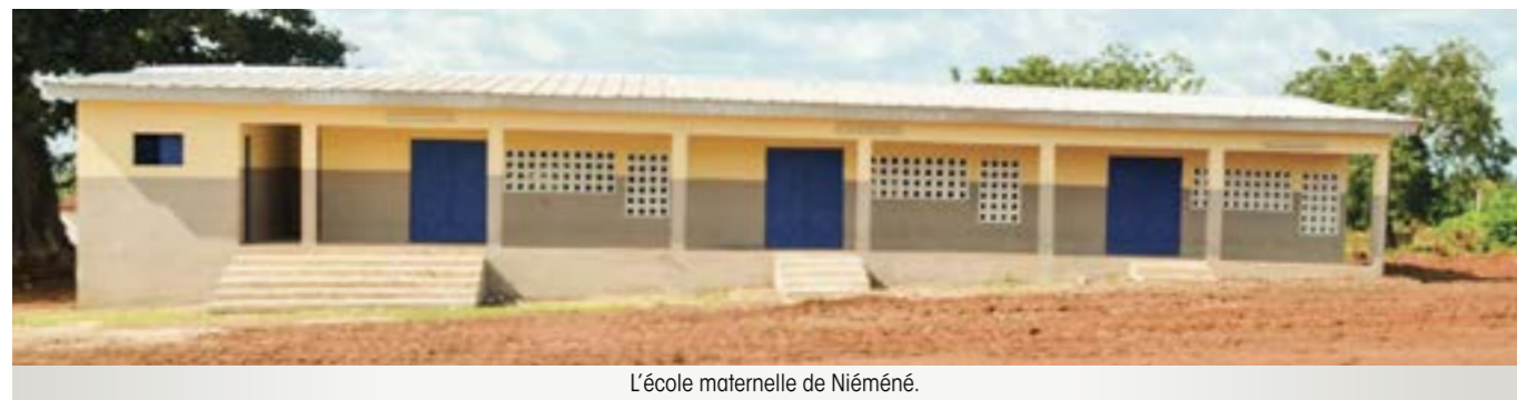
L'école maternelle de Niéméné.