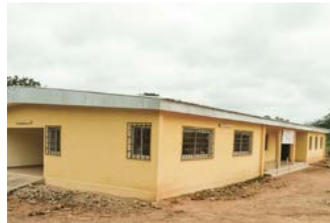
Le bâtiment abritant l'IEPP.