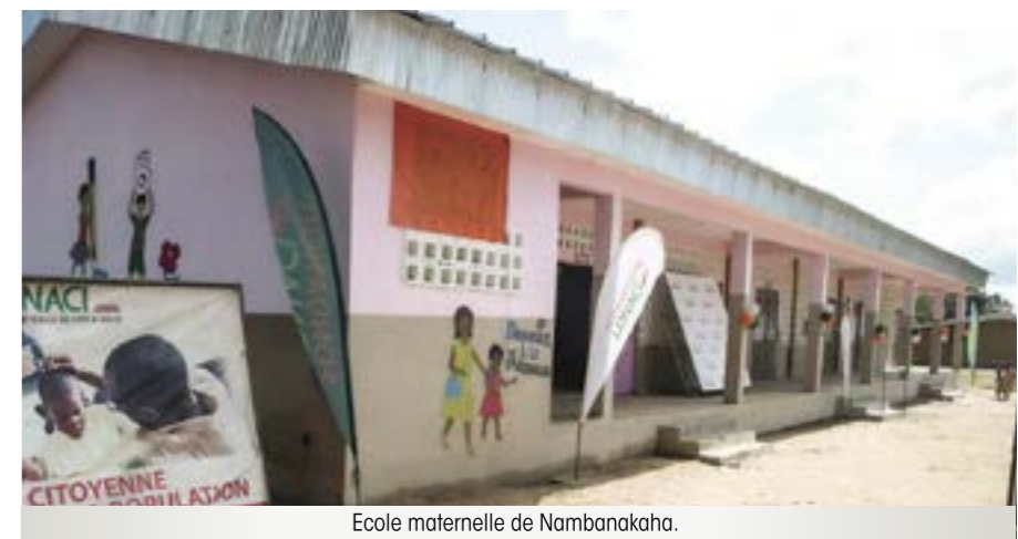
Ecole maternelle de Nambanakaha.