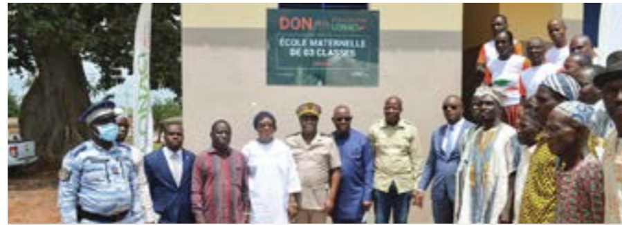
Les officiels après l'inauguration de cette école primaire.