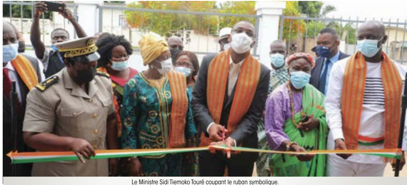
Le Ministre Sidi Tiémoko Touré coupant le ruban symbolique.