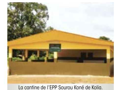
La cantine de l'EPP Sourou Koné de Kolia.

qualité de vie et le niveau scolaire à Kolia.