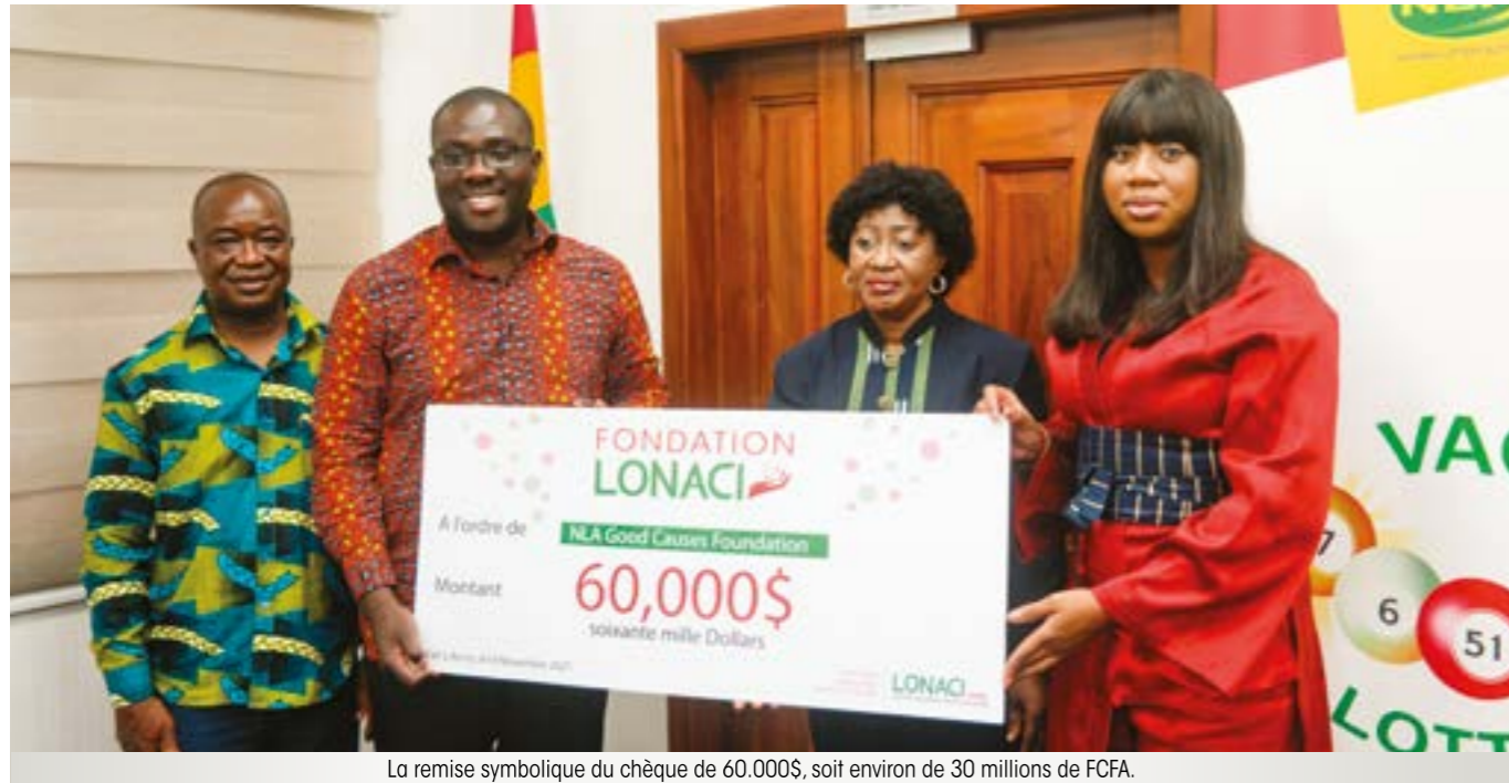
La remise symbolique du chèque de 60.000$, soit environ de 30 millions de FCFA.