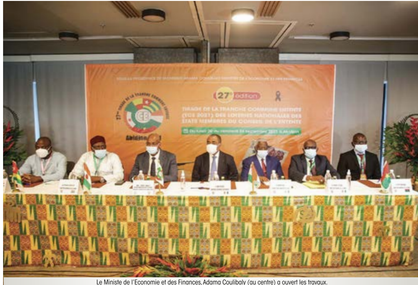
Le Ministre de l'Economie et des Finances, Adama Coulibaly (au centre) a ouvert les travaux.