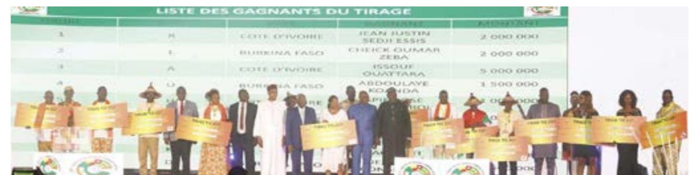
Les différents lauréats de l'appel à projets ont reçu leurs chèques au cours de cette soirée.