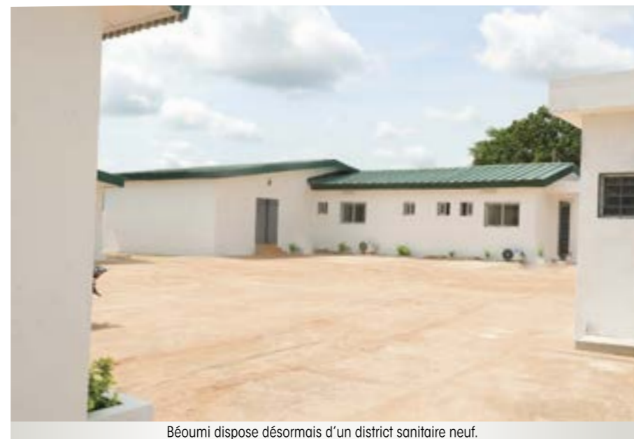
Béoumi dispose désormais d'un district sanitaire neuf.

Quant au ministre Sidi Tiémoko Touré, il s'est réjoui de la réalisation de cet ouvrage qui cadre parfaitement avec l'un des objectifs majeurs assignés au gouvernement, c'est-à-dire faciliter l'accès des populations aux soins de santé.