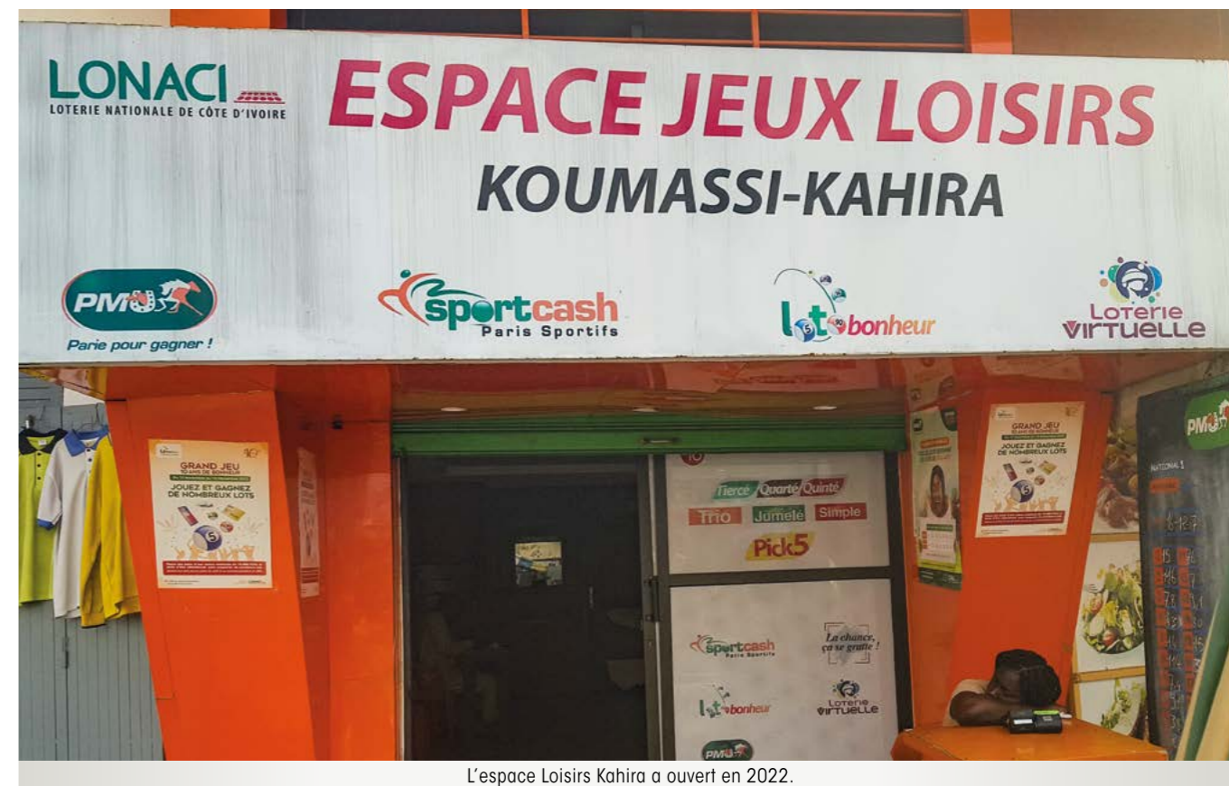
L'espace Loisirs Kahira a ouvert en 2022.