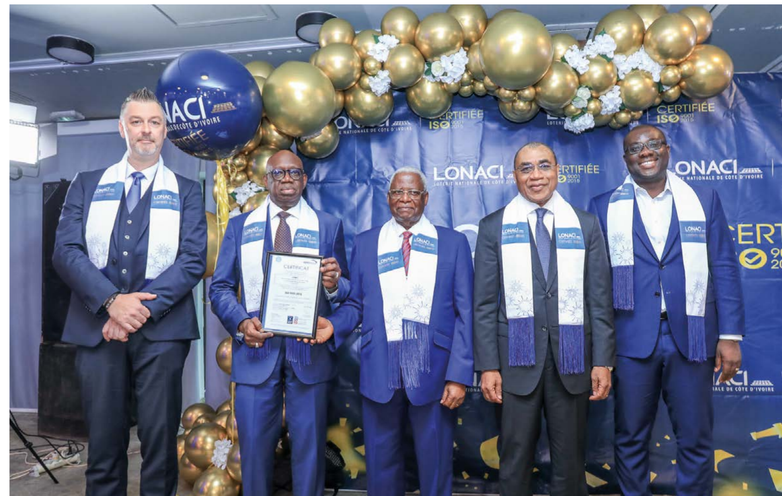
Le Ministre Adama Coulibaly (2 ème de la droite vers la gauche) a présidé la cérémonie de remise du certificat de la LONACI.