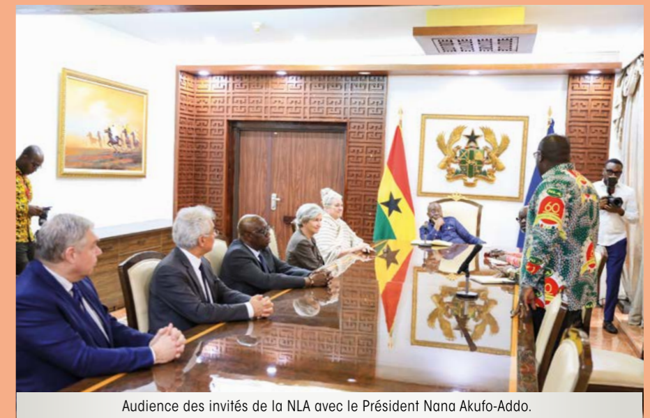
Audience des invités de la NLA avec le Président Nana Akufo-Addo.