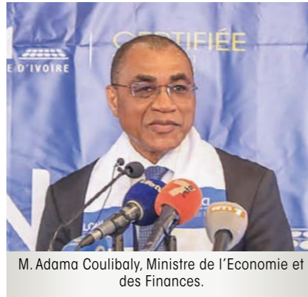
M. Adama Coulibaly, Ministre de l'Economie et des Finances.