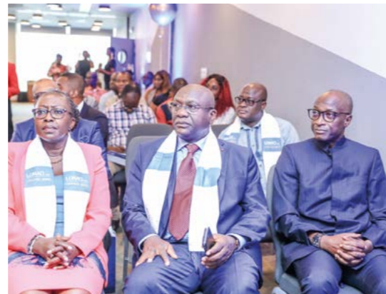
La cérémonie a enregistré la présence de plusieurs membres du comité de direction de la LONACI ainsi que des agents.