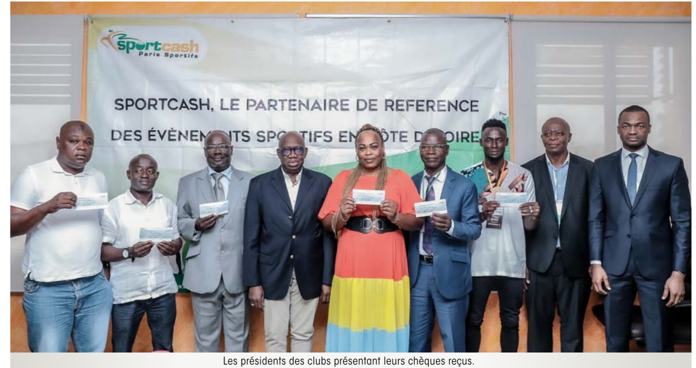
Les présidents des clubs présentant leurs chèques reçus.