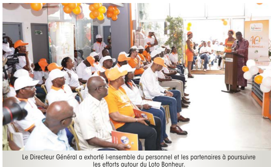
Le Directeur Général a exhorté l'ensemble du personnel et les partenaires à poursuivre les efforts autour du Loto Bonheur.

Plusieurs activités seront au programme de ces festivités : une vaste campagne de communication ; des tirages sur des places publiques ; un grand jeu consommateur tant sur le canal digital que le réseau physique permettant de gagner des machines Loto Bonheur et d'autres lots ; ainsi que des visites surprises sur des points de vente pour récompenser les joueurs.