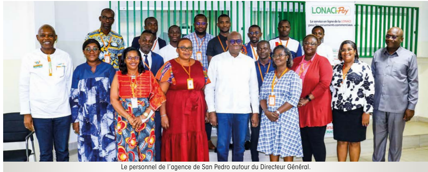
Le personnel de l'agence de San Pedro autour du Directeur Général.