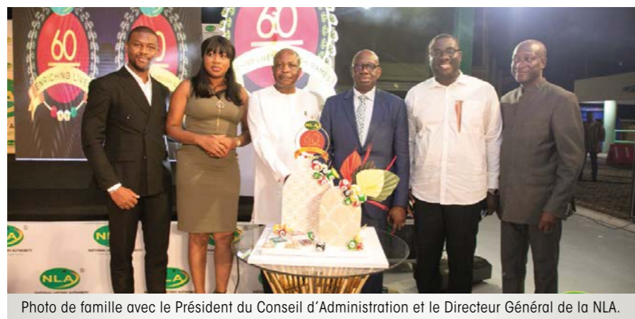
Photo de famille avec le Président du Conseil d'Administration et le Directeur Général de la NLA.